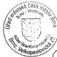
Ing. Květoslav Pekárek vedoucí Odboru finančního a výstavby ÚMČ Brno-Vinohrady

Proti tomuto rozhodnutí lze podat odvolání na základě ustanovení § 16, § 20 odst. 4 zákona o svobodném přístupu k informacím. Odvolací lhůta činí na základě ustanovení § 20 odst. 4 zákona o svobodném přístupu k informacím ve spojení s § 83 odst. 1 správního řádu 15 dnů ode dne oznámení rozhodnutí. Odvolání lze podat u zdejšího úřadu.