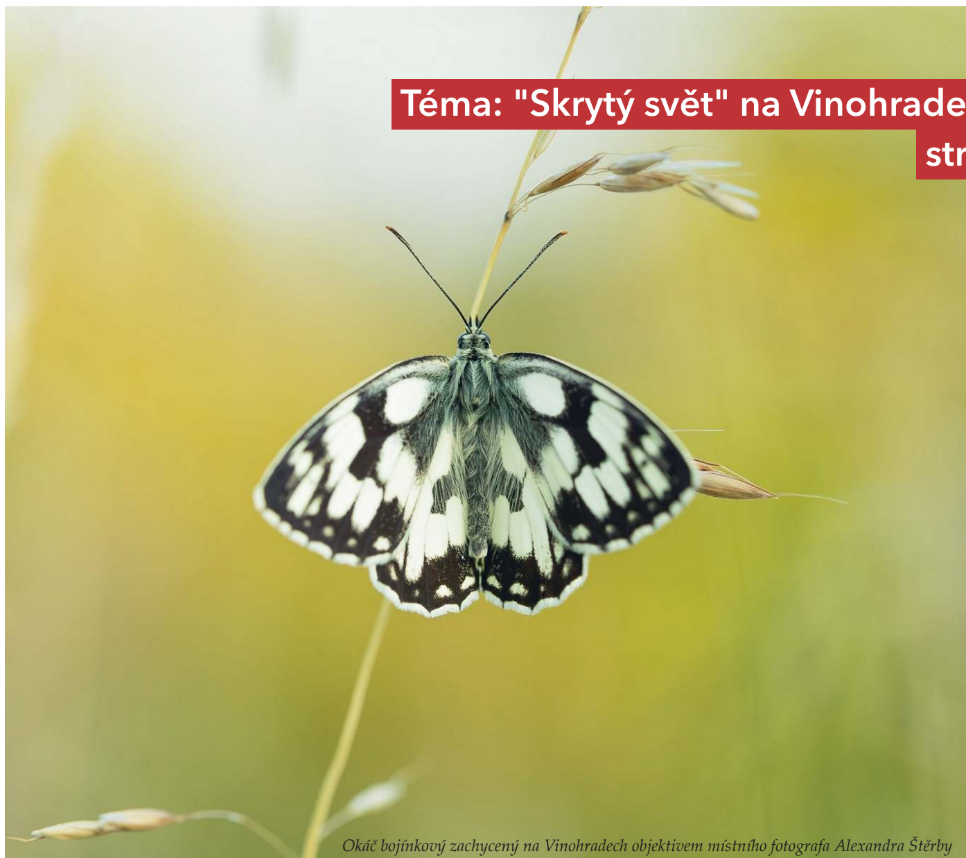
Okáč bojínkový zachycený na Vinohradech